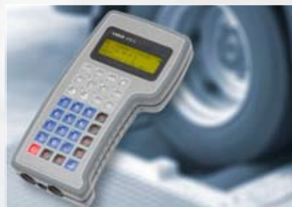
Uređaj za programiranje i kalibriranje digitalnih tahografa

oko redovitog prijena podataka sa svojih kartica. TIS (Tachograph Information System) rješenja uključuju još i Office varijantu za veće centralizirane vozne parkove te Compact varijantu za manje prijevoznike. TIS-Office je modularni programski paket kojeg korisnik prilagođava svojim potrebama tako da uz osnovni modul na svoje računalo (ili mrežu) instalira i željene dodatne module. Također omogućava bežični prijenos podataka (DLD), ali i ostale načine - putem memorijskog sticka Downloadkey II, čitača kartica ili terminala za prijenos podataka. Moguća je i digitalizacija listića analognih tahografa u mješovitim voznim parkovima te njihovo sparivanje sa zapisima digitalnih tahografa. TIS-Compact III je memorijski stick s integriranim softverom za arhiviranje podataka, koji se spaja na tahograf i zahvaljujući izdašnoj memoriji omogućava čak 4.000 prijena. Dodatna mini SD kartica umetnuta u TIS-Compact