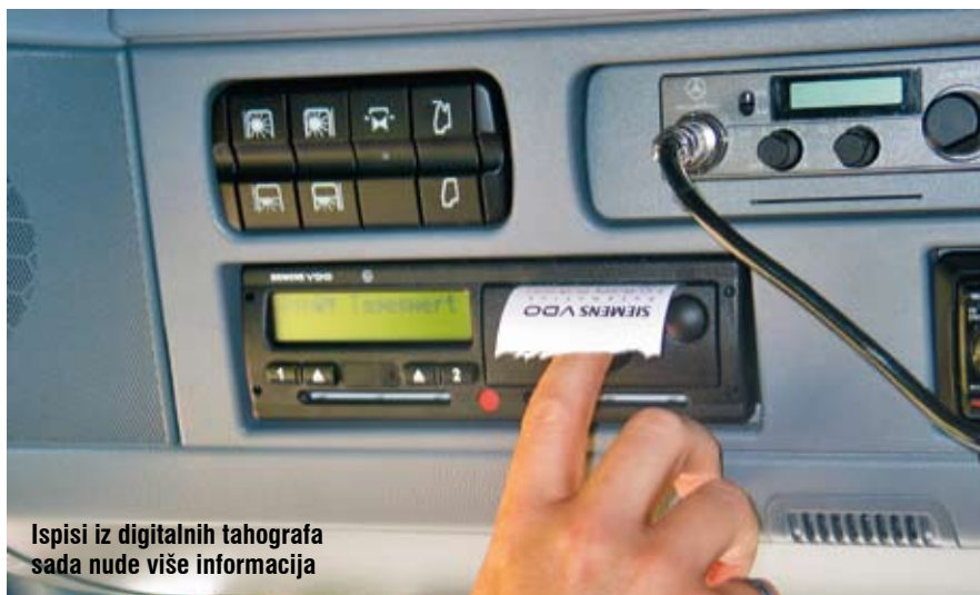
Ispisi iz digitalnih tahografa sada nude više informacija

III omogućava kreiranje sigurnosne kopije (backup) podataka. Arhiva se može čuvati na ovom uređaju, a putem USB sučelja može se prebaciti i na računalo gdje se podaci mogu vizualizirati i analizirati. TIS-Compact III odmah i upozorava na eventualno kršenje propisa o maksimalno dopuštenom vremenu vožnje i minimalnom trajanju pauza i odmora. Ukoliko ugrađene diode svjetle zalano sve je u redu, no ako se koja zacrveni učinjen je neki prekršaj. Treba još napomenuti da DTCO 1831 1.3a umjesto ranijih 24 sata detaljnog zapisa brzine pohranjuje čak 168 sati i omogućava njen ispis po danima. Dakle, dobije se 24-satni dijagramski prikaz baš kao i na analognim listićima (samo što nije kružnog oblika).